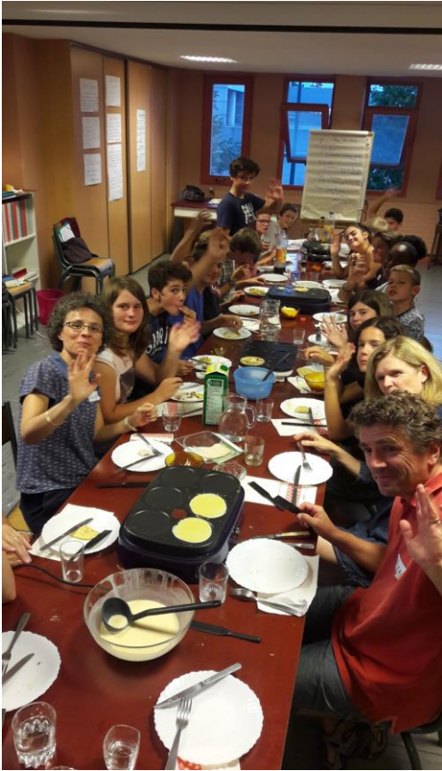
Le repas crêpes de la journée de rentrée des caté (les 12 à 15 ans)

Les petits du jardin biblique découvrent cette année des "histoires de la Bible" .